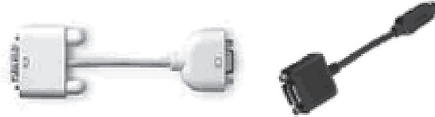
〔付属外部出力ケーブル〕